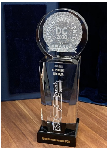
Russian DC Awards 2020 в номинации «Лучшее ИТ-решение для ЦОДа»